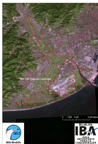
Important Bird Area 140 del delta del Llobregat