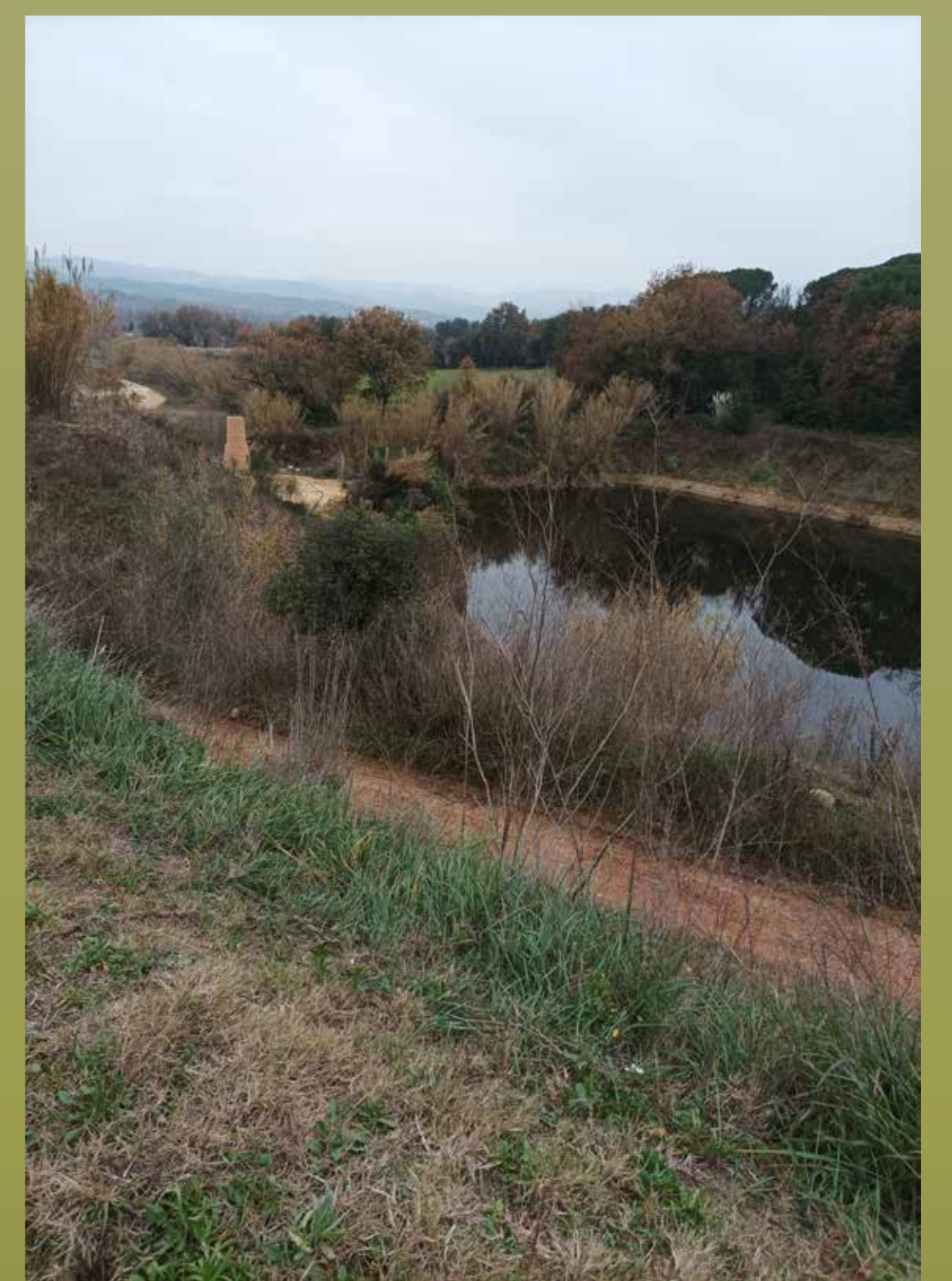
Bassa nova del Puigventós (2021)

CAL CONFIRMAR LA ASSISTÈNCIA I LA RESERVA A: cepa@cepa.cat